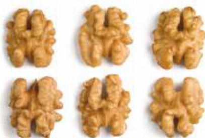
Halves / Jumătăți

STORAGE AND GUARANTEED SHELF LIFE: Storage: - cool and dry places - temperature: +2 - +7 degrees - humidity: 50-70% Shelf life: - 6 months for bulk, if stored under recommended conditions - 12 months for vacuum, if stored under recommended conditions