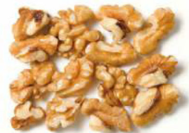
Mixture / Mixtură