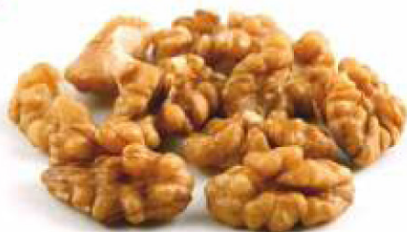
Quarters / Sferturi